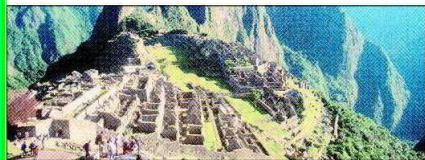
秘魯的馬丘比丘印加城堡是世界七大奇景之一。

級二夜旅館住宿。若您想要在造訪秘魯前，來點前菜的話，就到世貿一館攤位號碼A區1516的秘魯國家館，請您品嚐秘魯有機咖啡和pisco sour美酒。展會期間報名預定參加2011年1月至3月出發，秘魯12天至16天團體旅遊行程，優惠1萬元。（謝凱利）